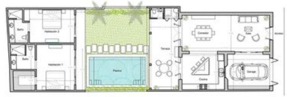
PLANTA ARQUITECTÓNICA VIVIENDA